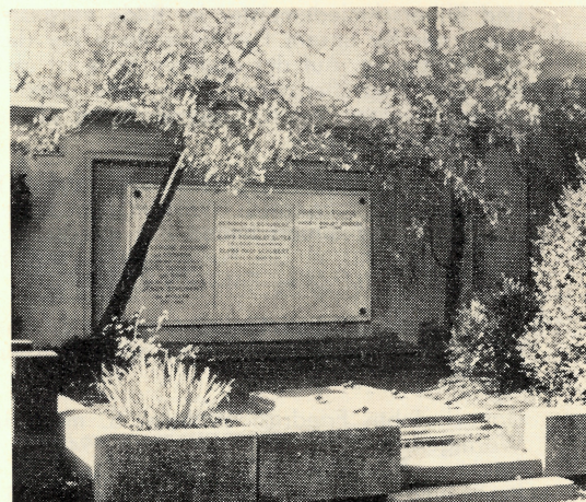
Erbgruft der Familie Schubert-Siebrecht in Bukarest

das Behelfsspital in Goddelau. Unterernährung im Zweiten Weltkrieg raffte dann auch meine liebe Mama dahin, indem sie am 15. Febr. 1946 beim Schlafengehen einen Schwindelanfall bekam, hinfiel und den Oberschenkelhals brach. Im Streckverband erlag sie dann wegen Kreislaufschwäche am 23. Febr. 1946 dem Unfall. Eingeäschert im Krematorium zu Darmstadt, konnte die Urne erst im Nov. 1946 in Bensheim zur letzten Ruhe bestattet werden, nachdem wir Eltern der Meinung wurden, daß der zufällige Aufenthaltsort Bensheim uns zur dauernden Wohnstätte werden könnte.